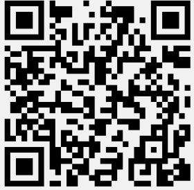
Solicitud de campamento

Consulte el código QR a continuación y las instrucciones sobre cómo registrarse: