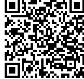
FORMULARIO DSS (Solo si solicita un subsidio para el cuidado infantil)