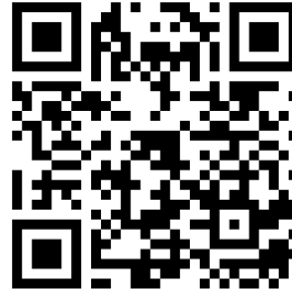
Solicitud de beca